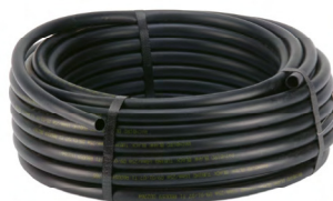
DBL: černé potrubí bez kapkovačů