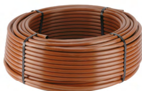
XF SERIE: hnědé potrubí bez kapkovačů